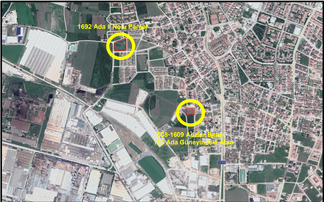
Şekil 1: Plan Değişikliğine Konu Alanın Konumu

Bursa İli, İnegöl İlçesi, Alanyurt Mahallesi, 1692 Ada 1 Nolu Parsel ile 1608-1609 Adaların Batısı, 125 Adanın Güneyindeki Alan; Alanyurt ilçe merkezinin batısında, İnegöl Organize Sanayi Bölgesinin kuzeydoğusunda konumlanmıştır. 1692 Ada 1 Nolu Parsel; batı yönünde Osmangazi Caddesi, güney yönünde 2. Sanayi Caddesi, kuzeybatı yönünde Fevzi Çakmak Caddesine cephelidir. 1608-1609 Adaların Batısı, 125 Adanın Güneyindeki Alan ise doğu yönünde Alapınar Sokak, kuzey yönünde Değirmen Caddesine cephelidir.